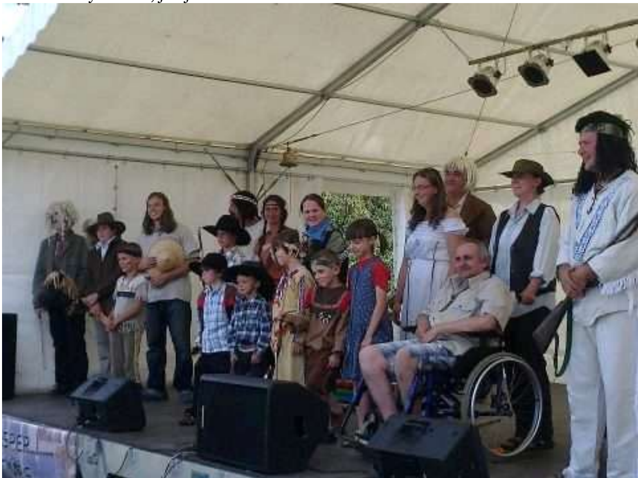
ěkovačka po představení hry „Jak se píše román“

Jak vidno z titulní strany, kniha je také o briardech. A ti nesměli chybět na jejím křtu. Ten se odehrál ve dnech 18-19. srpna ve Stránském na divadelním festivalu nazvaném MEZI OHRADNÍKY. Festival mezi ohradníky tentokrát zorganizovalo občanské sdružení Stránské spolu se Sociálně terapeutickou dílnou Buřinka, Diakonie ČCE střediska v Rýmařově. Tato dílna pracuje s osobami s mentálním a kombinovaným postižením. Na festivalu se představily divadelní soubory a různé amatérské hudební skupiny. Divadelní soubor PEC, občanského sdružení Stránské uvedl svoji novou hru JAK SE PÍŠE ROMÁN. Přítomní diváci si v průběhu konání festivalu vynutili její opakování. Což je událost i u divadelních festivalů nebývalá. O tom všem se dozvíte na http://www.stranske.com . A nyní ještě pár fotografií z tohoto festivalu, do jehož programu patřila také tradiční soutěž v sečení trávy. Kosou, jak jinak.